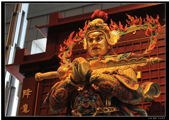
(韋馱菩薩永鎮魔軍)

如果有機會到廟宇參觀或祭拜，經常可以看到手持金剛杵，做武將打扮的韋馱神像，韋馱菩薩是佛家弟子非常熟悉的佛教護法天神，在佛教寺院中，擔任護持僧眾、宏演佛法的任務。