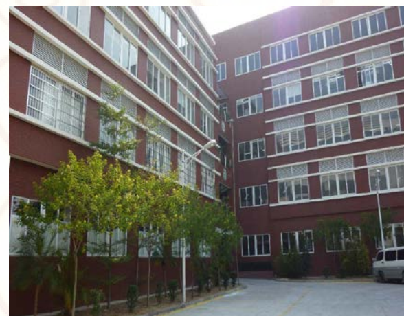
下圖：鞋廠辦公大樓