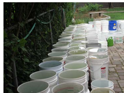
回收的塑膠桶儲存的雨水

時候才能變成人身，什麼時候才能坐在佛堂里呢？變成個鳥來拜佛，讓佛又有什麼好的辦法呢！只能授它三皈依，讓它來日做人好修行！”