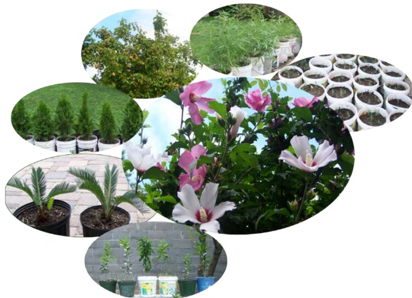
Pure Land in My Heart---- DAMI Temple in New York

早課剛結束，師父高興地走進佛堂來說：“你們看，鳥兒聽到你們唱贊子和念佛的聲音，從四面八方都飛來了，都到咱們佛堂門口來了，有些鳥兒還不敢見佛，躲在樹背後”。正說著，一隻鳥兒飛到了佛堂門口。“你們看，鳥飛進來拜佛了！”師父又說，大家暗自稱奇。“一說它，它還不好意思了”，師父剛說完，那只鳥拍著翅膀又飛走了。