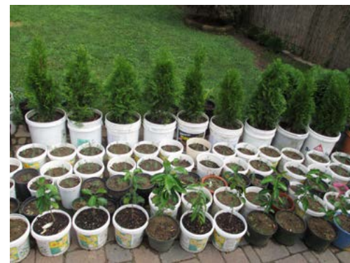
各種種子在佛堂紮根生長

看著飛去的鳥兒，師父歎了一口氣，似在對我們說，又似在對鳥兒們說：“你們坐在屋子裡念佛多好呢，幹嘛非得等變成鳥兒的時候才知道回頭呢？等變成鳥了再念佛，什麼