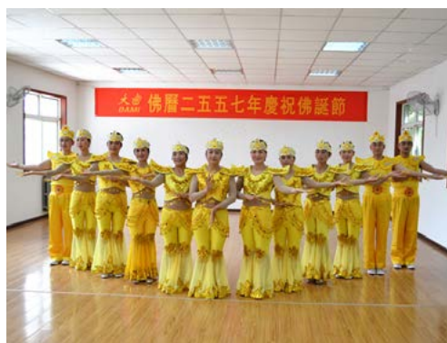
▶ 舞蹈《水月觀音》演員們的演出服都是大家一針一線縫製的。