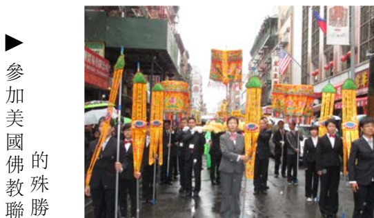
參加美國佛教聯合會浴佛遊行大法會的殊勝洲居士們