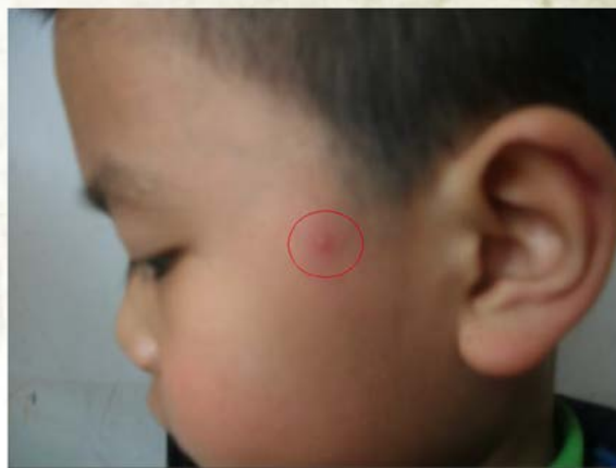
圖一：3月2日孩子面部排毒點