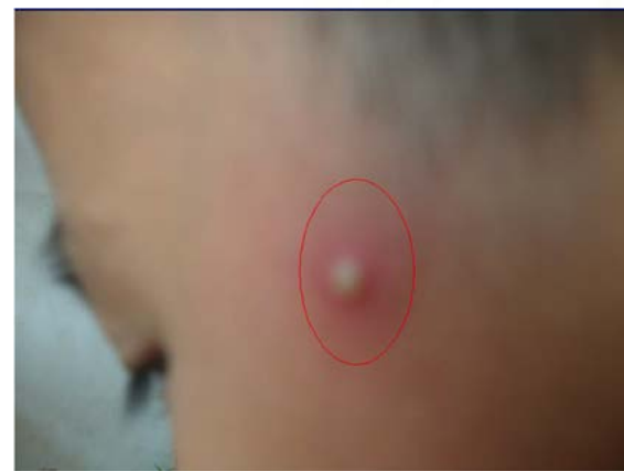
圖二：3月5日孩子面部排毒點

我查閱了中醫資料，得知孩子的排毒點在足陽明胃經和手陽明大腸經的循行線上。右臉頰上出現的排毒點在胃經循行線上，胃經主治消化系統病癥，手陽明大腸經主治體內實熱。